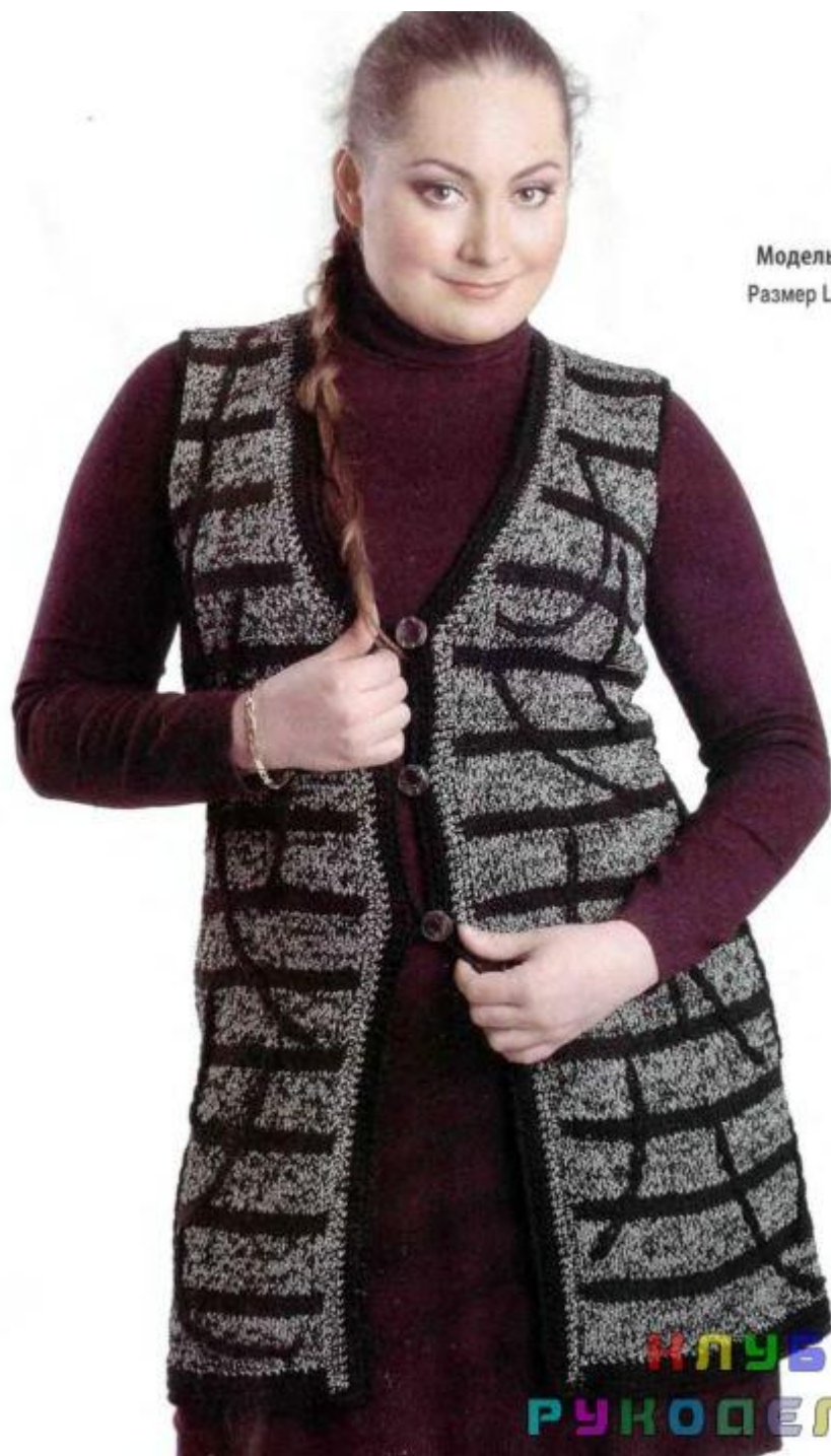
Модель 3 Размер L-XL